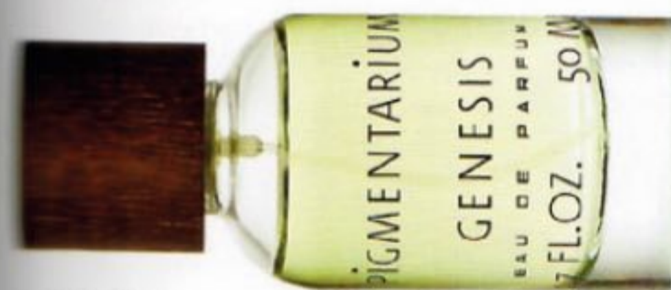
1 Parfémová voda Genesis, PIGMENTARIUM, 3300 Kč 2 Porcelánový stojan na vonné tyčinky Incense Altar by Daniel Pirč, PIGMENTARIUM, 1990 Kč

Příjemně, jak jinak. Každému podle jeho vnímání světa. Ale té vůni by zcela jistě předcházela komunikace, transparentnost a upřímnost. ■